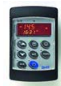
XW700V: formát 64 x 100 mm

Nový dvojitý displej s ikonami a velká vnitřní paměť umožňují jednoduché použití :