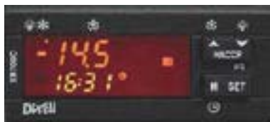
XW700C: formát 74 x 32 mm

Teplota hraje důležitou roli při sledování kvality potravin dle systému HACCP. Nová série regulátorů XW700 pro chlazení je schopna splňovat požadavky systému HACCP . Klasické rozměry regulátorů do panelu – formát C, byl doplněn ještě o dva formáty WING série – podélný L a vertikální V (přímé vypnutí a zapnutí, výstup pro kompresor 20A, programovací klíč, přímý přístup k hlavním funkcím a snadné ovládání).