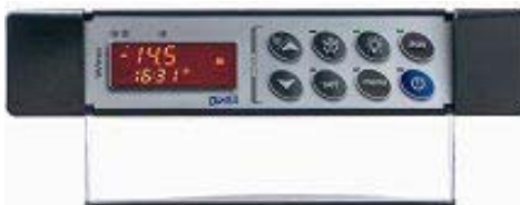
XW700L: formát 185 x 38 mm